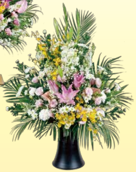
枕花1本 10,800円 税込