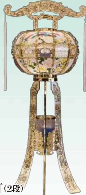
東山灯(2段) 120cm・ゴールド・1対 27,000円 (税込)