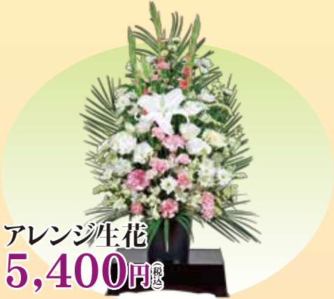
アレンジ生花 5,400円 税込