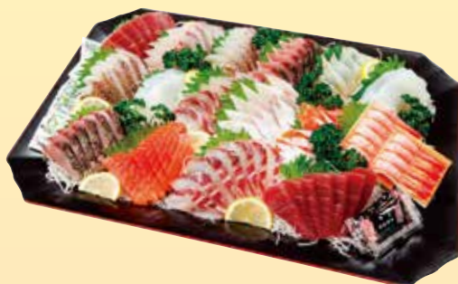
お刺身盛り合せ ※写真は 5,400円 3,240円 (税込) ~ 5,400円 (税込)