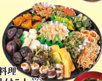
おとき料理 (みそ汁付5人前) 3,240円 (税込)