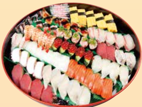
にぎり寿司盛り合せ ※写真は 5,400円 3,240円 (税込) ~ 5,400円 (税込)