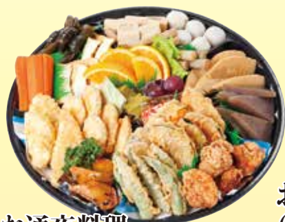
お通夜料理 3,240円 (税込)