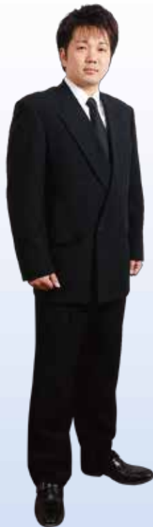
◆紳士礼服 5,400円 (税込)