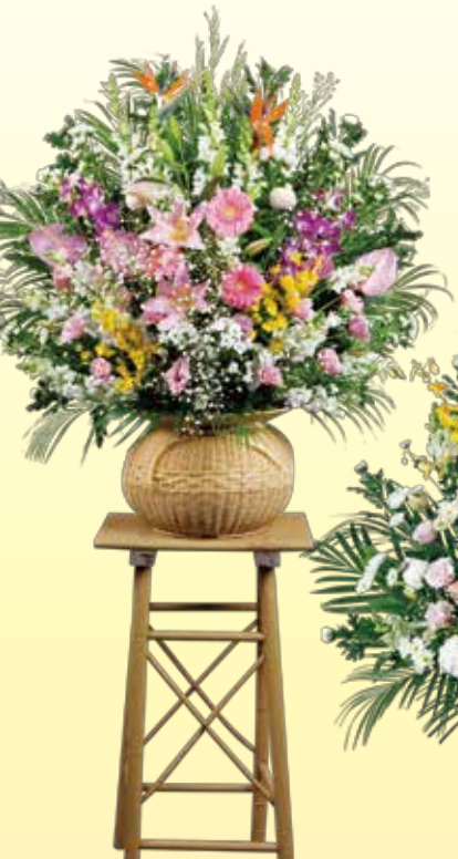
生花スタンド(ダルマ)1本 16,200円 税込