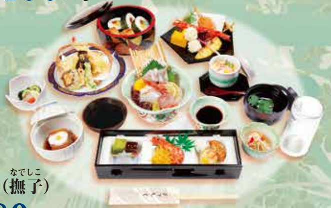
◆法事会席(撫子) 3,780円 (税込)