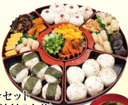
おときセット (みそ汁付5人前) 3,780円 (税込)