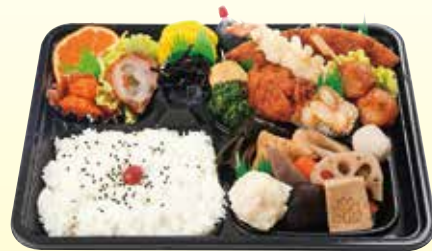
お弁当 ※写真は 860円 540円 (税込) ~ 860円 (税込)