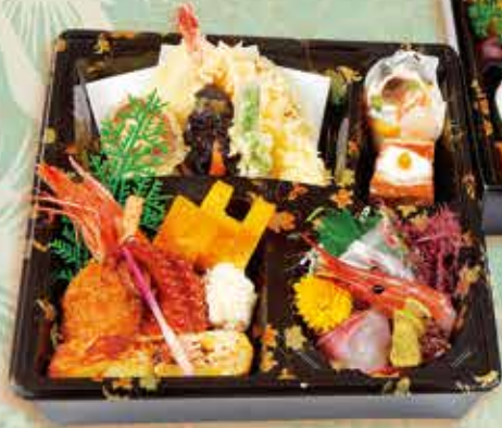
◆折詰め二段会席 3,780円 (税込)