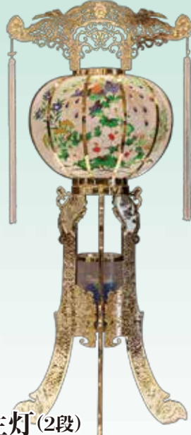
弥生灯(2段) 108cm・ゴールド・1対 21,600円 (税込)