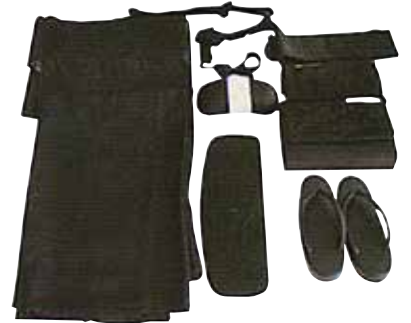
◆婦人喪服 12点セット (足袋別) 5,400円 (税込)