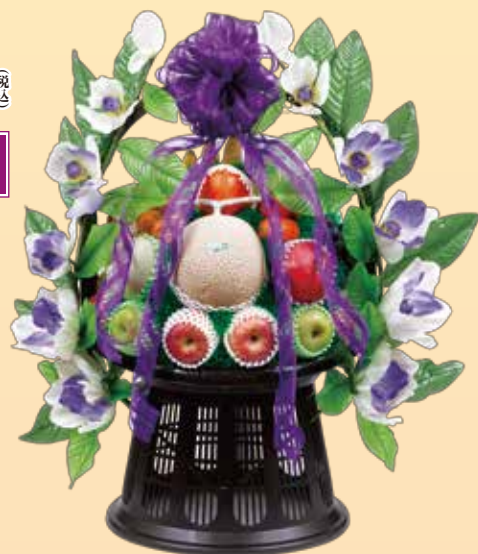
フルーツ籠盛り 11,000円 (税込)