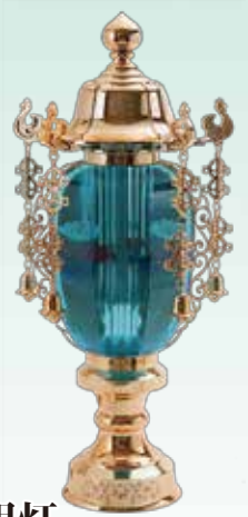
水明灯 38cm・1対 16,200円 (税込)