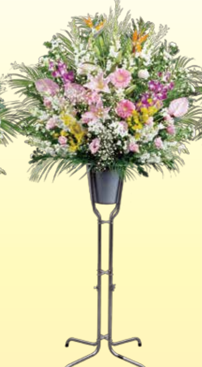
生花スタンド1本 16,200円 税込