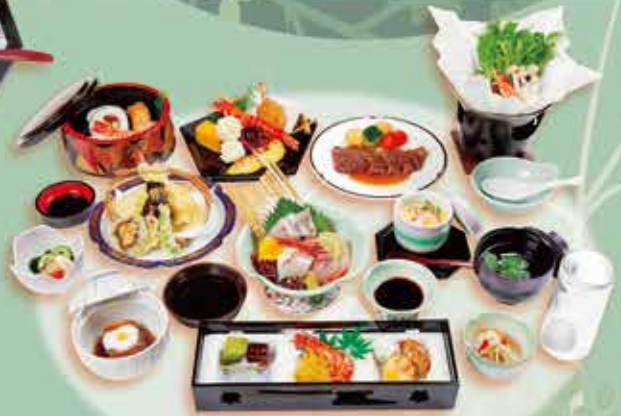
◆法事会席(白菊) 5,400円 (税込)