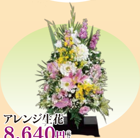
アレンジ生花 8,640円 税込