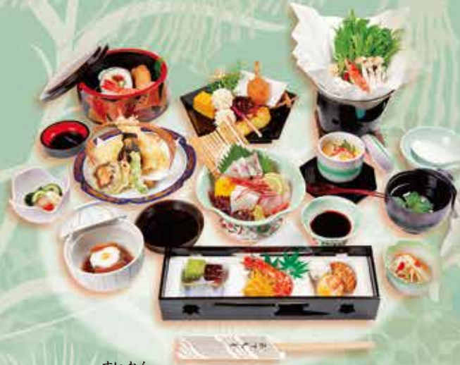
◆法事会席(睡蓮) 4,320円 (税込)