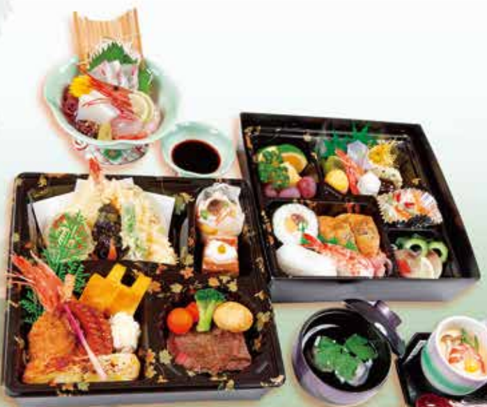
◆折詰め二段会席 4,320円 (税込)