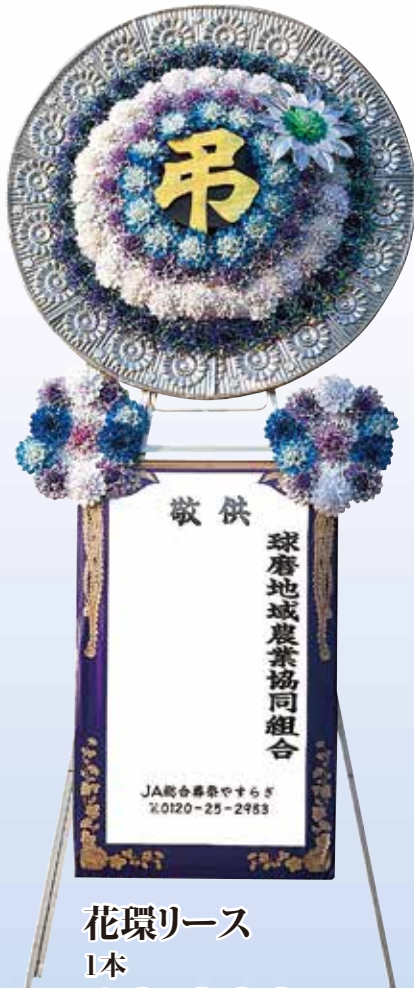
花環リース 1本 10,800円 (税込)