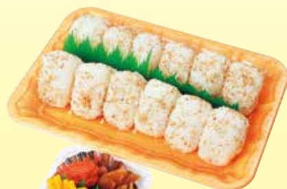
おにぎり(12ヶ入)(6人前) 935円 (税込)