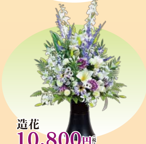
造花 10,800円 税込