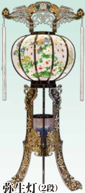
弥生灯(2段) 108cm・黒・1対 21,600円 (税込)