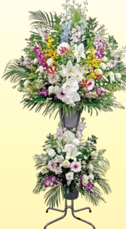
生花スタンド(2段)1本 21,600円 税込