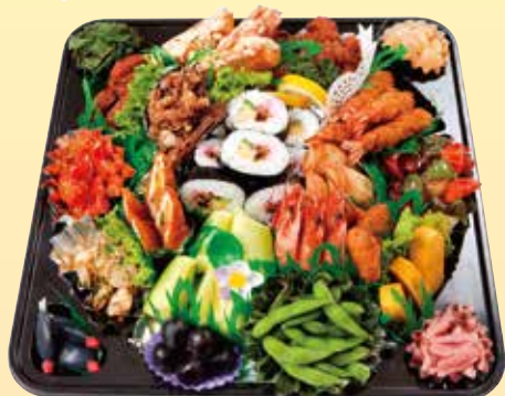
オードブル ※写真は 5,400円 (巻き寿司なしも出来ます) 3,240円 (税込) ~ 7,560円 (税込)