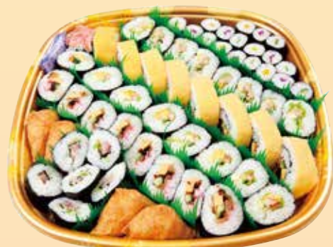
寿司盛り合せ ※写真は 3,240円 3,240円 (税込) ~ 5,400円 (税込)