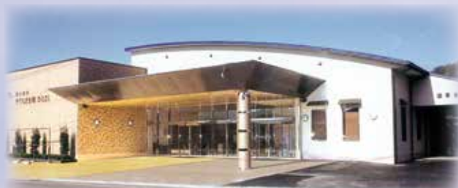
やすらぎ会館ひとよし

安心③ 万が一、中途解約の場合でも元金に利息を加え 掛けた分の金額 が受け取れます。