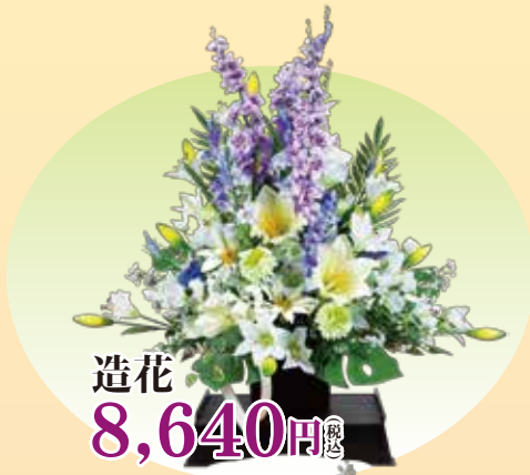
造花 8,640円 税込